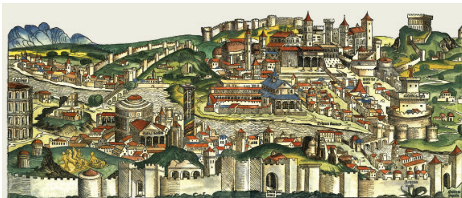
Roma, tratta da: Hartmann Schedel, Liber Chronicarum , Nuremberg 1493